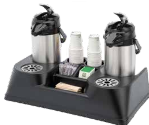
Présentoir pour thermos

Présentation élégante et pratique des boissons chaudes en mini-buffets avec cases pour sucre, cuillères, sachets de thé... Convient pour les deux modèles de thermos à pompe.