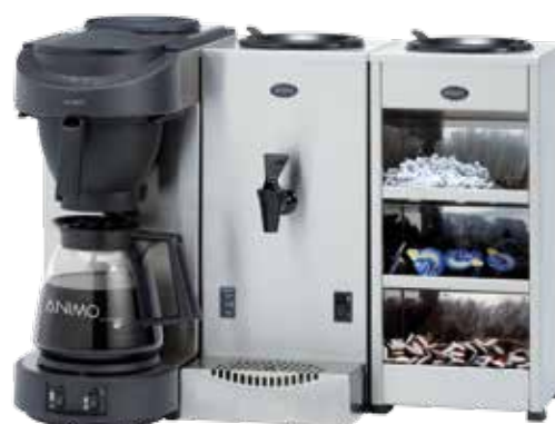
Bac à ingrédients

Un café préparé avec soin mérite d'être servi dans des tasses pré-chauffées. Le chauffe-tasses conserve mieux la température et le goût. Il permet un rangement pratique des tasses et des soucoupes, maintenues propres et sèches à la bonne température.