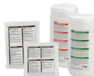
Détartrant et Nettoyant marc de café