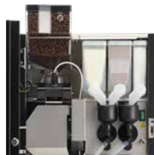
+ OptiBean 4, 2 mélangeurs et 3 bac à produits instantanés