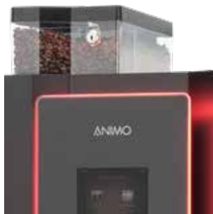
+ Des grains de café frais