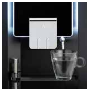
+ Sortie séparée pour l'eau chaude