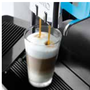
+ De nombreuses variétés de boissons, comme le Latte Macchiato