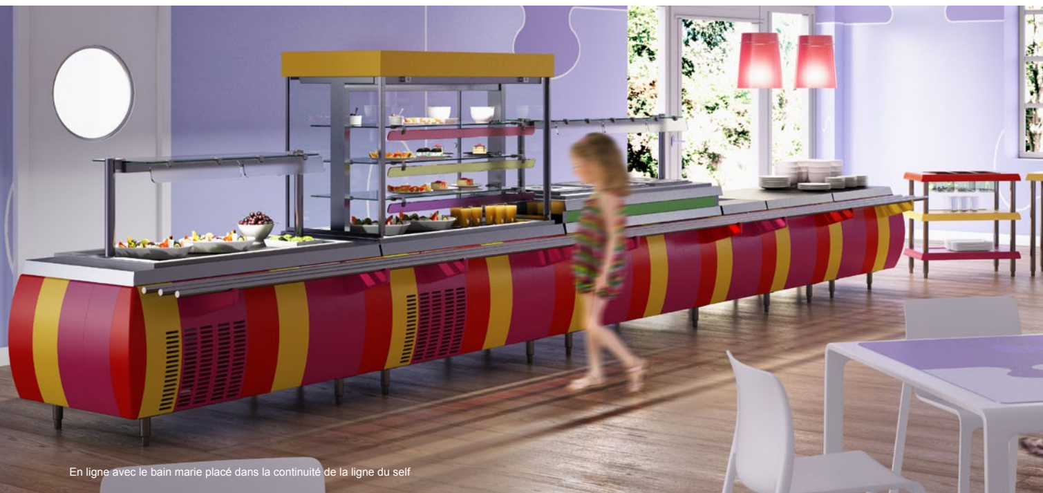
En ligne avec le bain marie placé dans la continuité de la ligne du self

Une gamme large ... de multiples configurations et des possibilités de personnalisation infinies