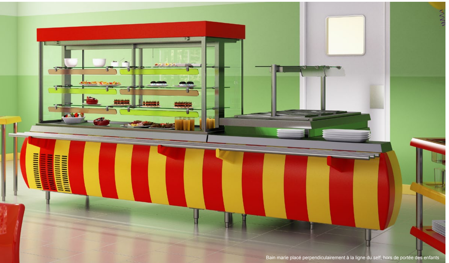
Bain marie placé perpendiculairement à la ligne du self, hors de portée des enfants