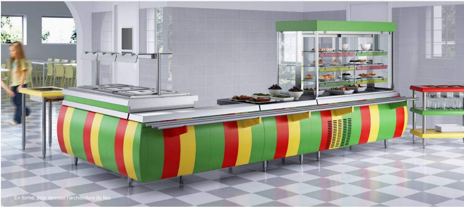
En forme, pour épouser l'architecture du lieu