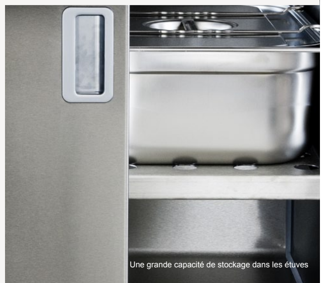
Une grande capacité de stockage dans les étuves