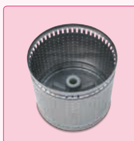
Panier d'essorage en acier inox