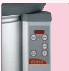
Tableau de commande plat et étanche (IP55)